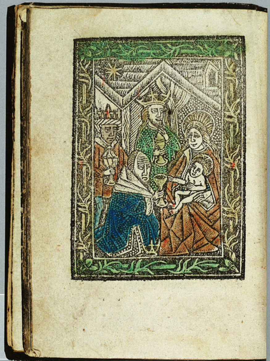
Een incunabel uit Bertholdus, Horologium devotionis. Keulen, circa 1488.