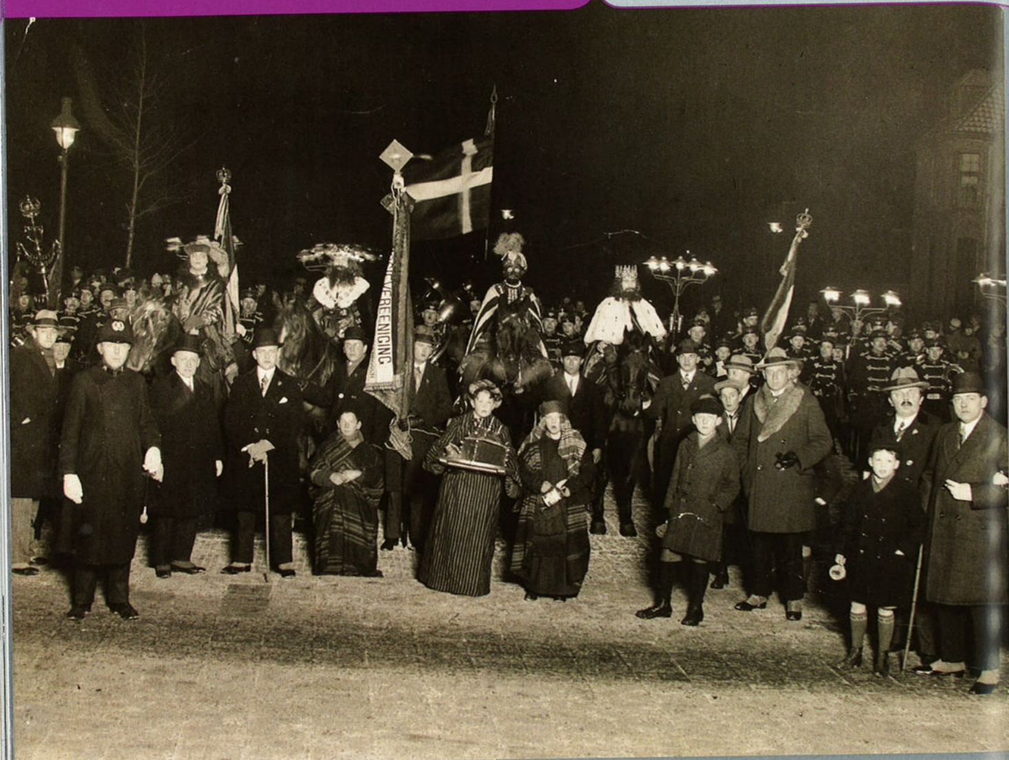
Driekoningentocht in 's-Hertogenbosch, circa 1930.