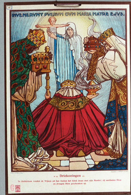
foto linksboven: Wandtegel Driekoningen Tilburg uit 1960. Maker onbekend. foto links: Schoolplaat van Jozef Speybrouck uit 1925. foto boven: Driekoningen met lampions, 's-Hertogenbosch. Ongedateerde pentekening van Herman Moerkerk. foto rechts: Koffiepak van de firma Van den Biggelaar.