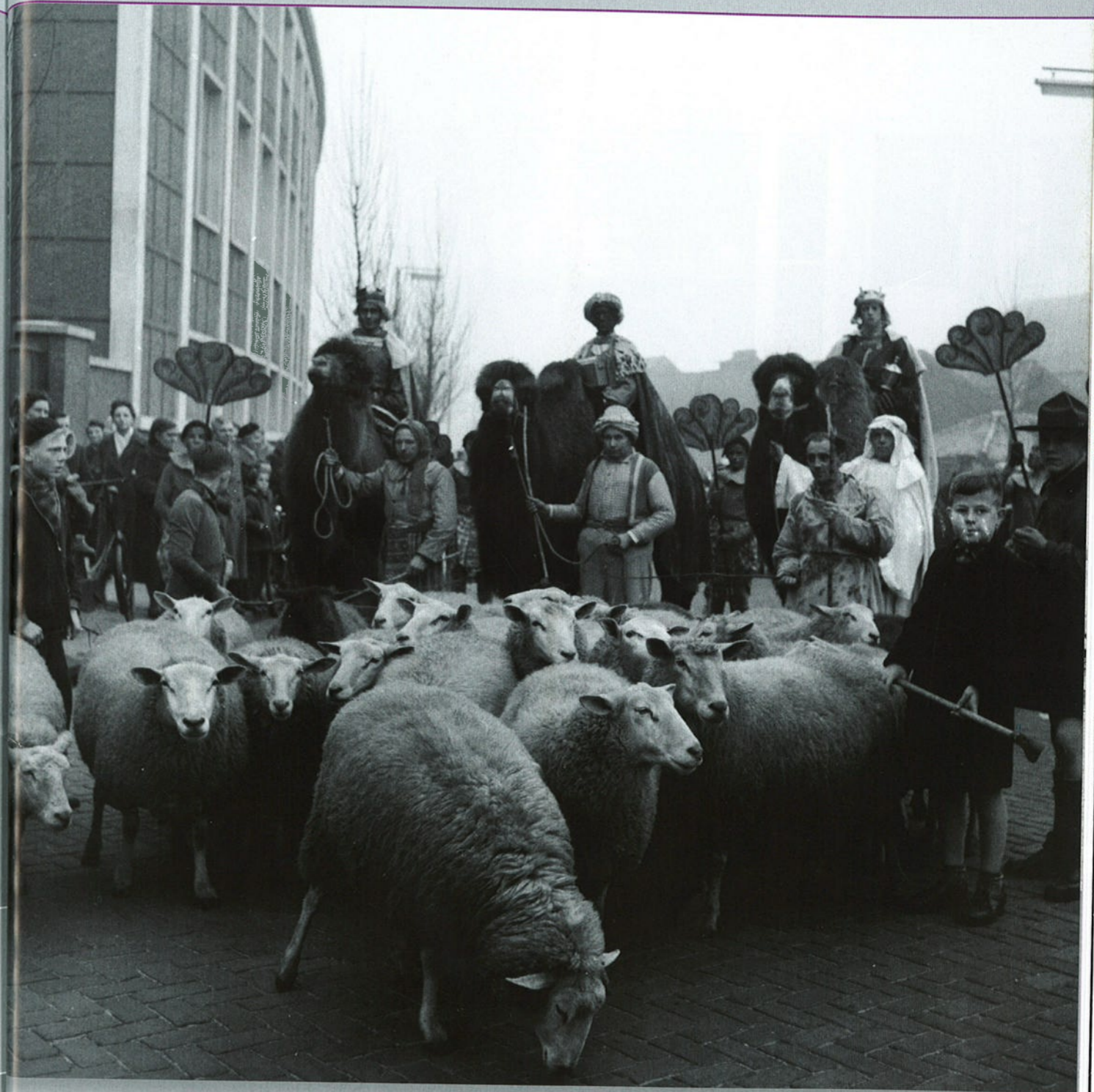
Driekoningentocht, Eindhoven, 1956.