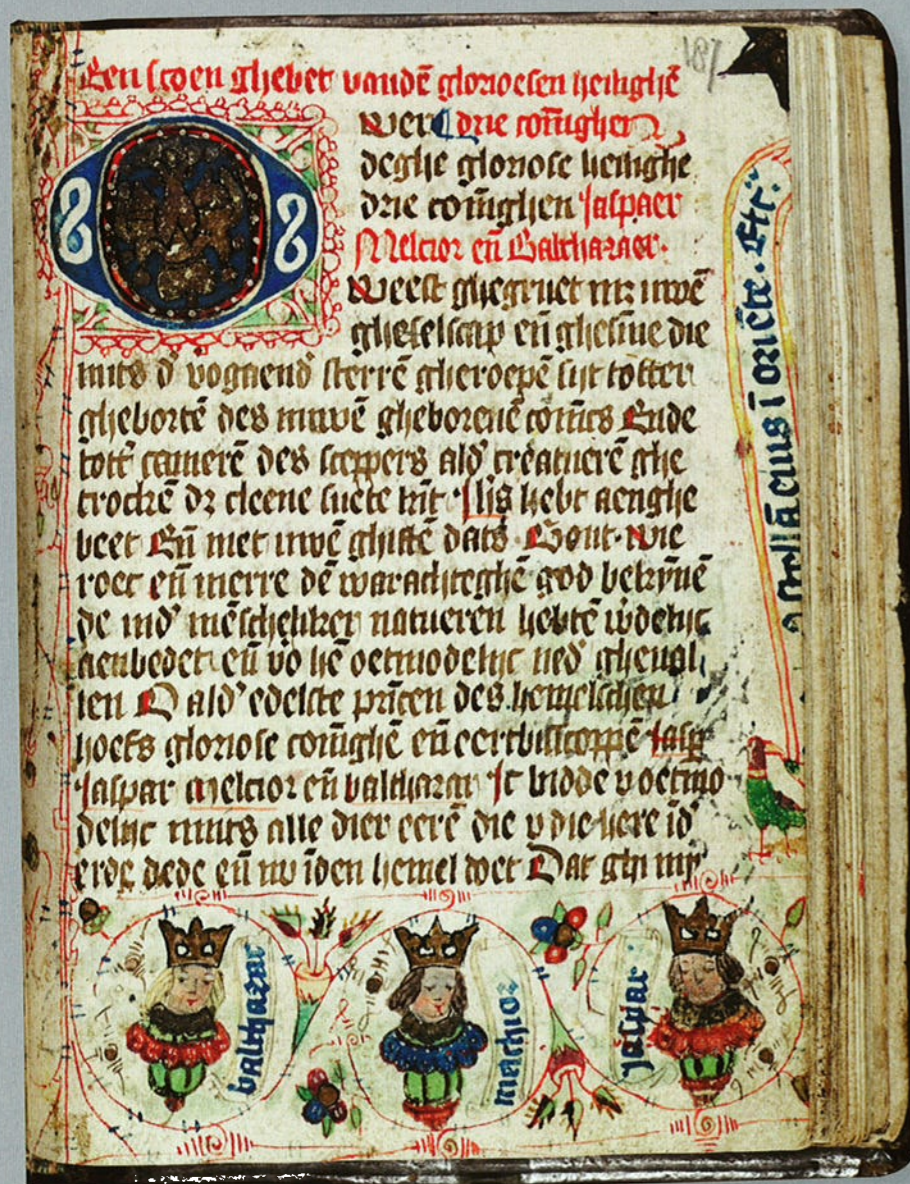
Drie koningen in de benedenmarge. Folio 187r uit het Gebedenboek, Zuid-Nederland, 1490-1500.