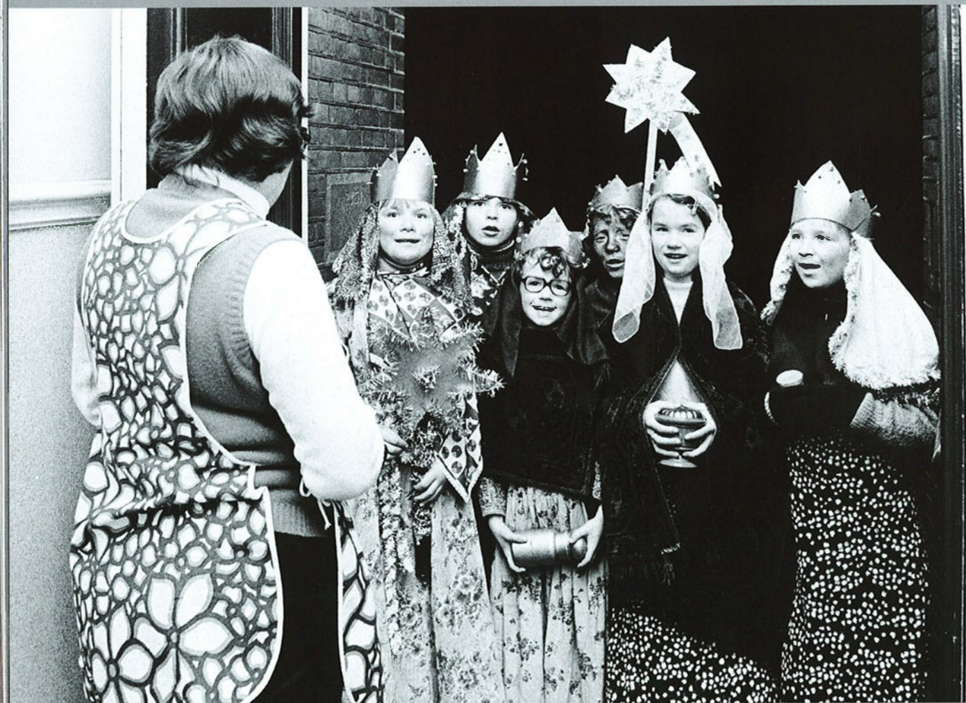
Baarle Nassau, 1975.