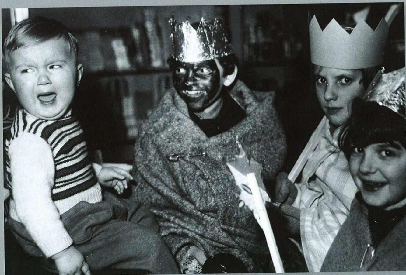
Wouw, 1955.