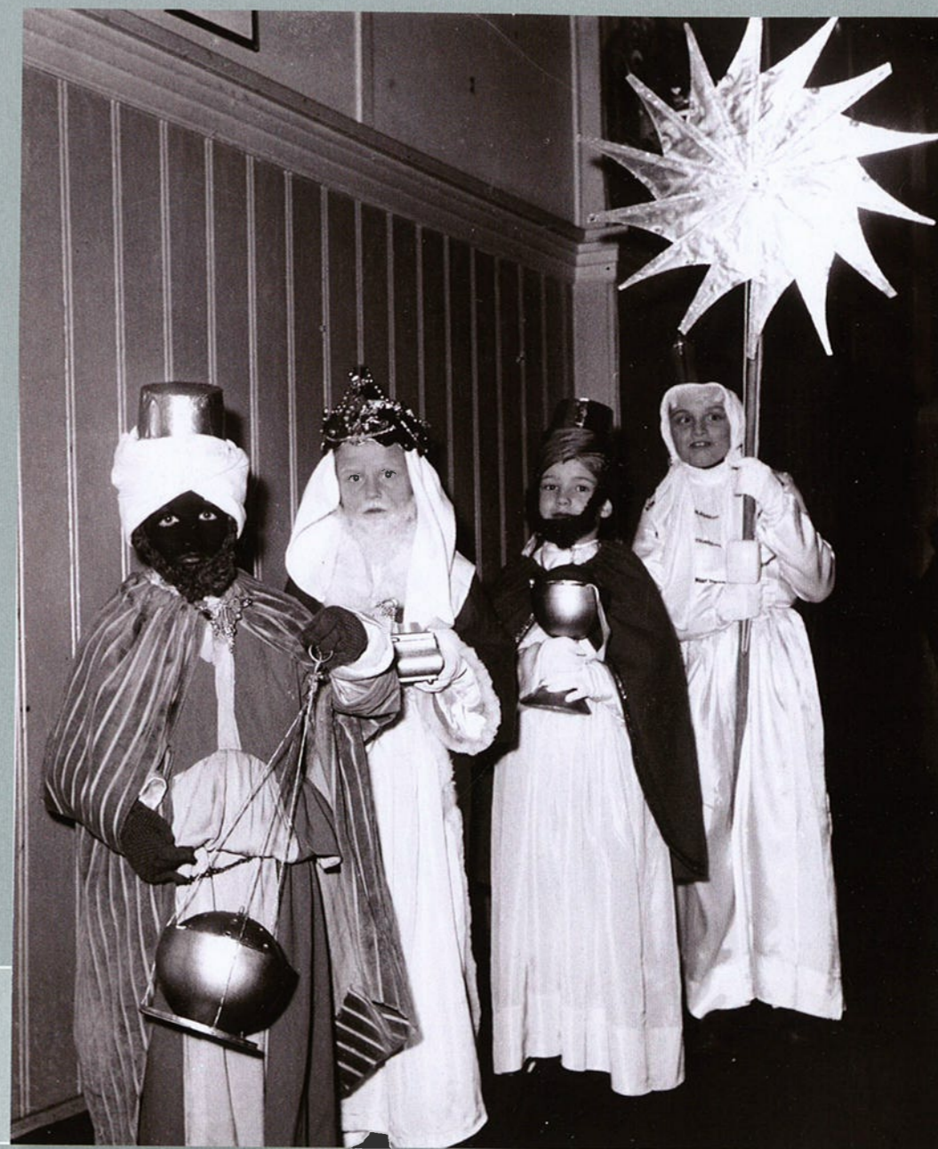
Tilburg, 1966.