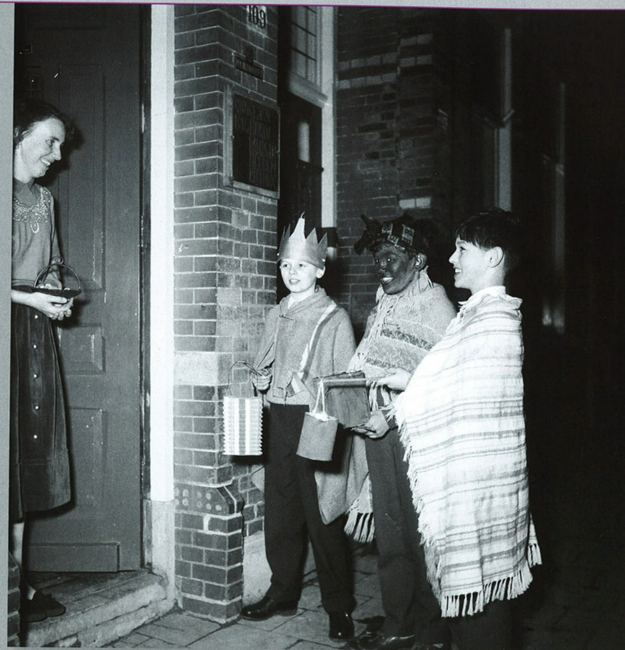
's-Hertogenbosch, circa 1940.