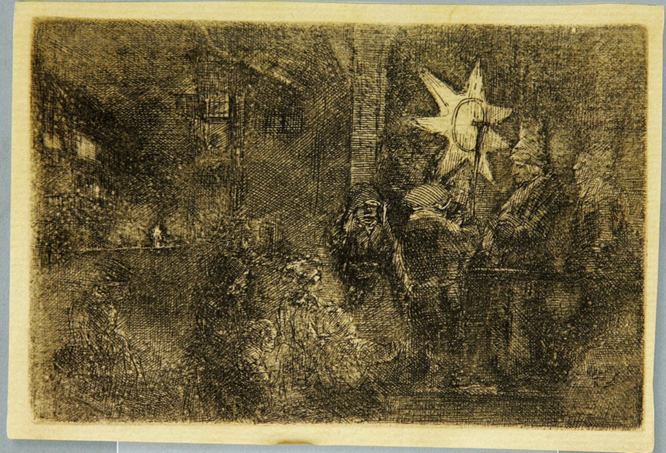
Ets van Rembrandt getiteld Driekoningen: een nachtstuk, omstreeks 1649-1653.

Hoewel het momenteel sterk afneemt, is het Driekoningenzingen in delen van Noord-Brabant nog een levende traditie. Zo organiseert de werkgroep van de Heemkundekring Tilborch in Tilburg en omstreken (Goirle, Moergestel, Loon op Zand, Hilvarenbeek en Alphen) jaarlijks een wedstrijd Driekoningenzingen in verschillende kerken, kappellen, buurthuizen, verzorgings- en wijkcentra – dit gebeurt in samenwerking met basisscholen, verenigingen en winkeliers. Tijdens de wedstrijd beoordeelt een jury de kinderen op zang, kleding en originaliteit. Er zijn allerlei prijzen te winnen en er worden chocomel en eierkoeken uitgedeeld. Wie een gouden boontje in de eierkoek vindt, mag zich voor één dag uitroepen tot koning en krijgt een extra prijs. Inmiddels staat het Driekoningenzingen in Midden-Brabant op de Nationale Inventaris Immaterieel Cultureel Erfgoed van UNESCO. Samen met andere regionale, nationale en internationale instellingen wordt er werk van gemaakt om deze eeuwenoude traditie levend te houden. ■