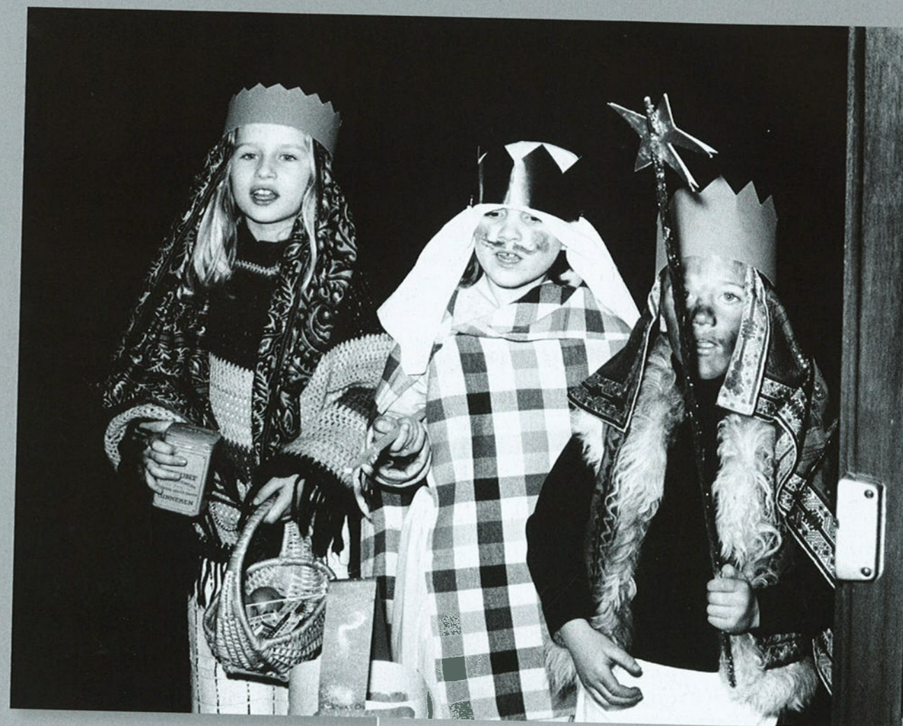
Waalwijk, 1980.