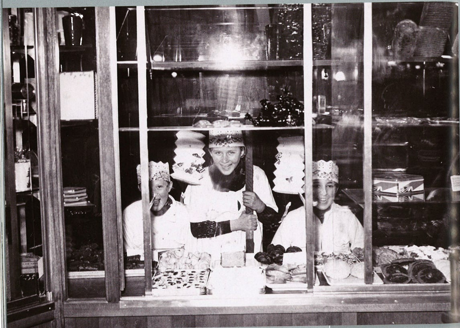
Driekoningenzangertjes voor etalage bakkerij in Tilburg, 1953.