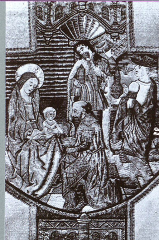
foto boven: Het tafereel van de Aanbidding van de Drie Wijzen (van oorsprong op een Bourgondisch kazuifel uit omstreeks 1510) op moderne stof in de St. Elisabethkerk. Grave, 1972. (Collectie: Brabants Historisch Informatie Centrum) foto onder: Driekoningenboon: porseleinen Frangipane figuurtjes, ca. 1870 (© Annie Schreuders Derks, 2008. Privécollectie)